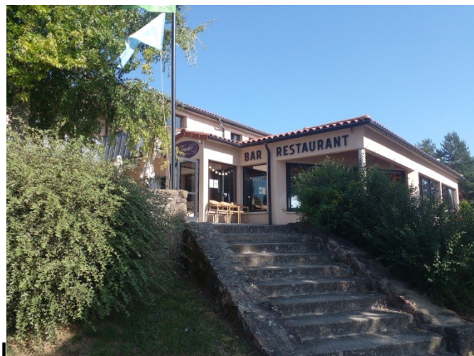
Notre hôtel camping

Au cours de ce séjour, 13 cyclos ont découvert les alentours du lac de Naussac en Lozère différemment, vélos longues distances, petits circuits et autres pratiques selon nos capacités.