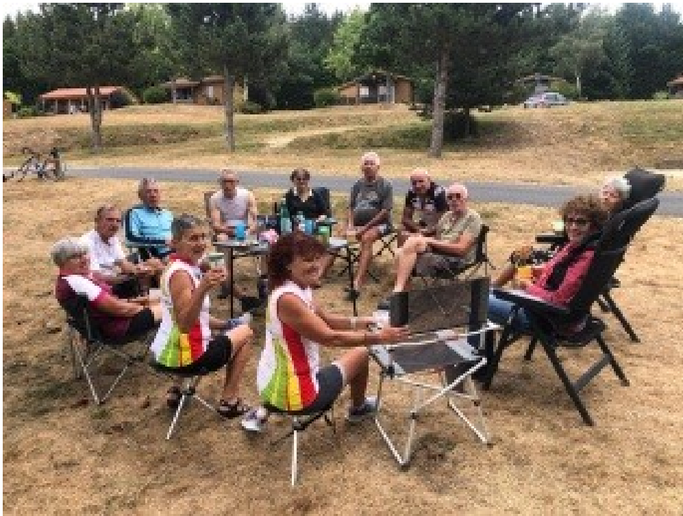
Après l'effort le réconfort