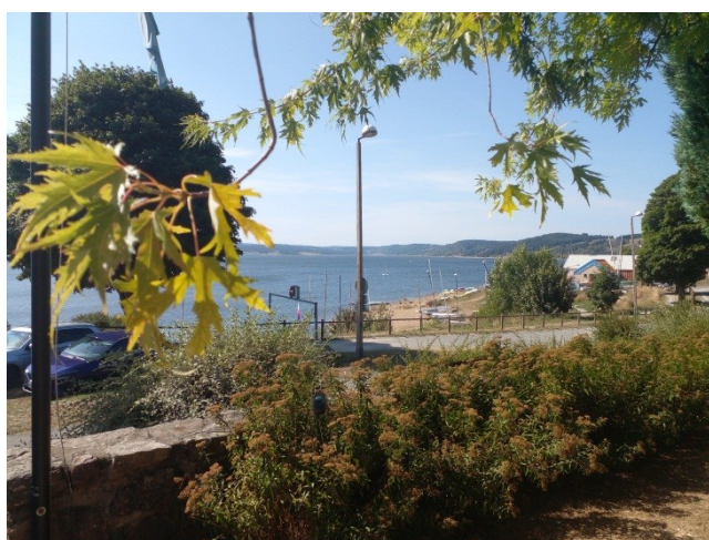
Vue sur le lac de l'hôtel