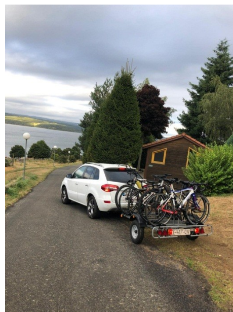
Au revoir fin de notre escapade en Lozère